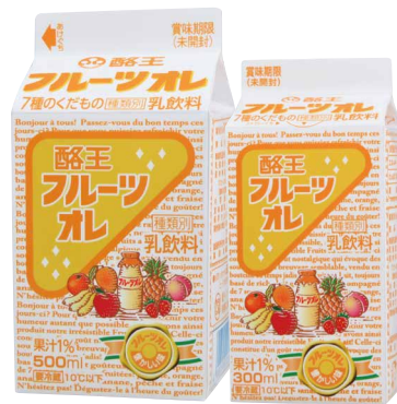
酪王フルーツオレ

■応募方法 キャンペーン対象商品の商品バーコードを切り取り、応募専用封筒または封書に「5枚1口（組み合わせ自由）」を入れて、A賞・B賞ご希望の賞、氏名、住所、ご連絡先（携帯電話可）、年齢、職業を明記の上ご応募ください。お一人様何口でもご応募いただけます。