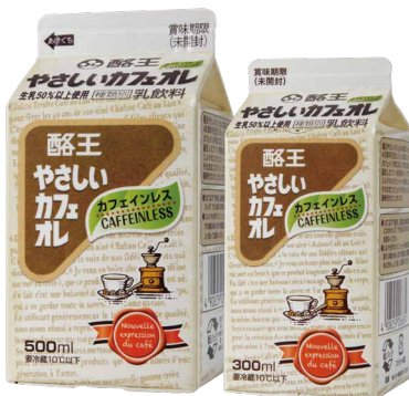
酪王やさしいカフェオレ