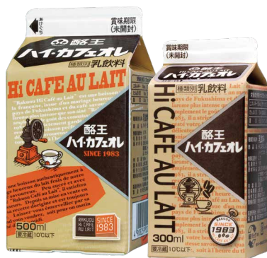
酪王ハイカフェオレ